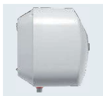
Корпус із ударостійкого пластику